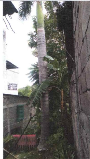
Figura 2. Vista vertical, se observa que la especie se encuentra ubicado en un callejón en colindancia a casa habitacional.