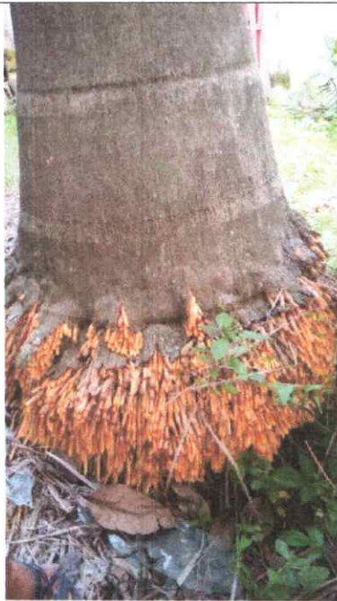
Figura 1. Raíces aéreas de la Palma Real ( Roystonea regia ), sus raíces se profundizan de manera que no es un riesgo para los ciudadanos o infraestructura.